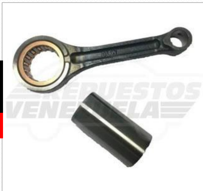
Biela Bera R1200