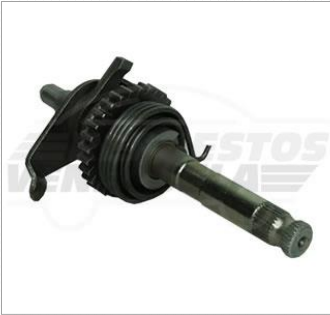
Eje Pedal Arranque Jaguar