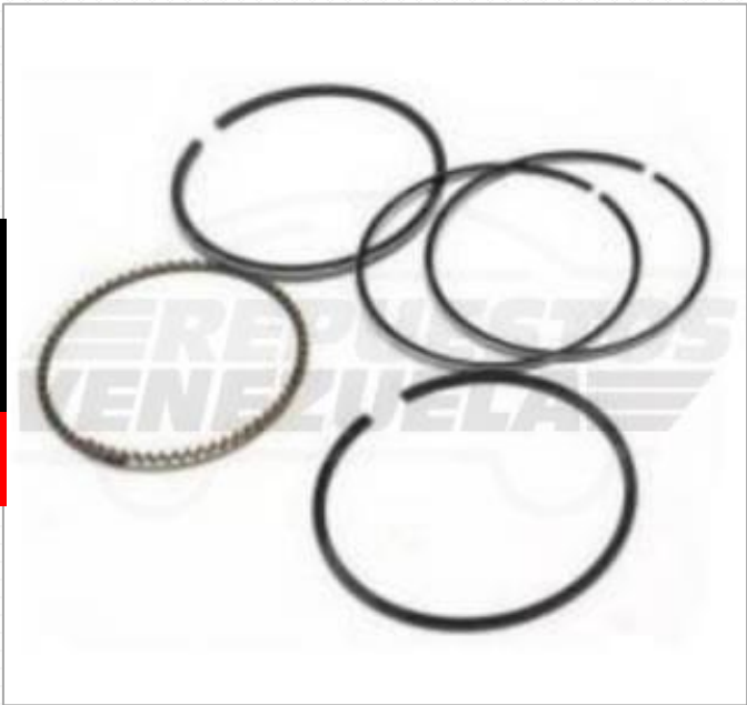
Anillo 0.75 Scooter 125 Código: 468-873