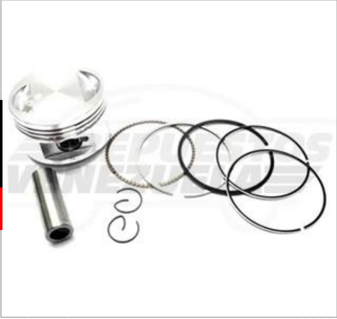
Pistón 0.50 Scooter 150 Código: 572-161