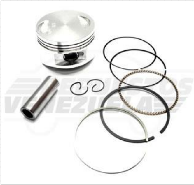
Pistón 0.75 Scooter 150 Código: 572-308