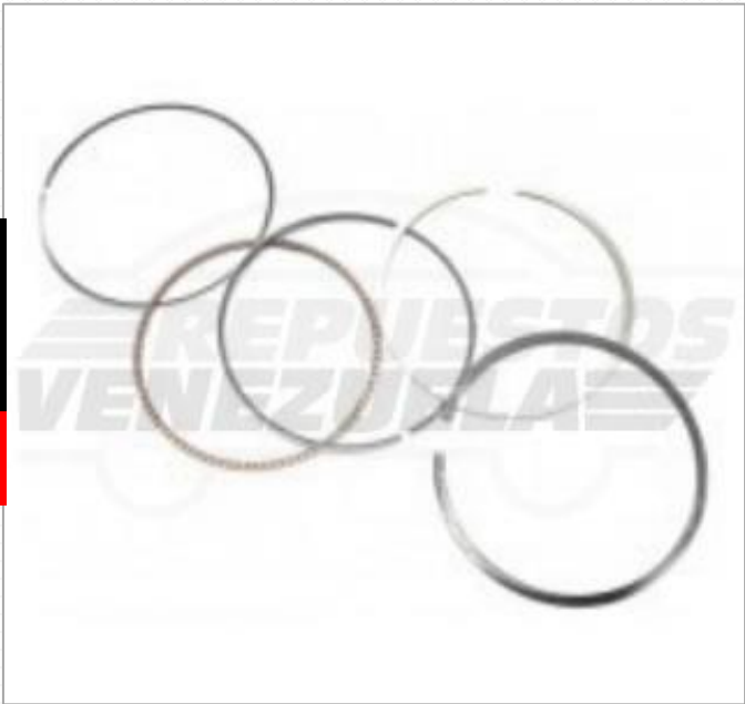
Anillo Dorado Matrix 150 0.25 Código: 111-002