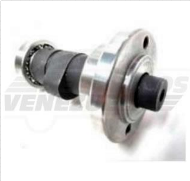
Árbol de Leva R1200