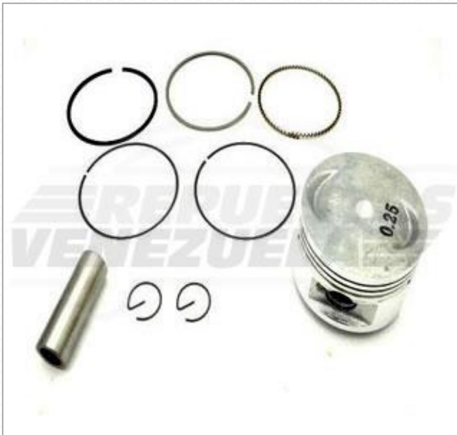
Pistón 0.25 Scooter 150 Código: 572-467