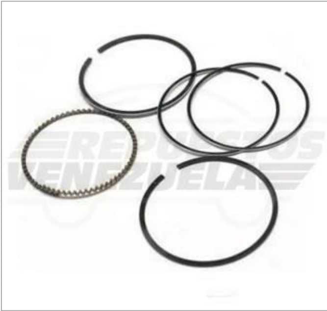
Anillo 1.00 Scooter 150 Código: 374-221