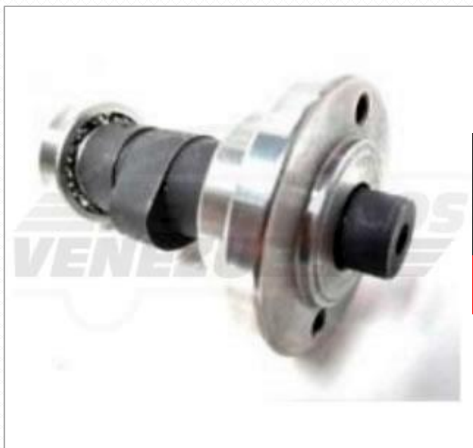
Arbol de Leva R1200