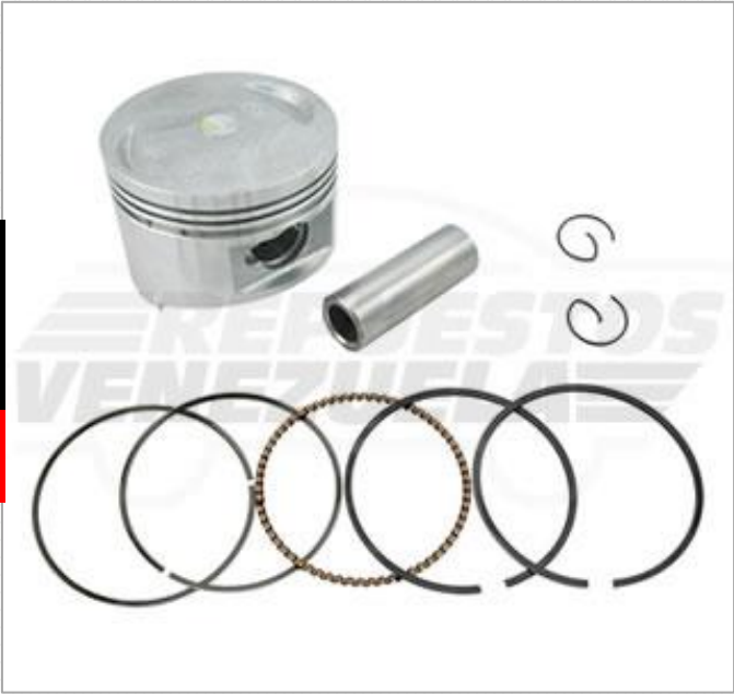
Pistón STD Scooter 150 Código: 570-349